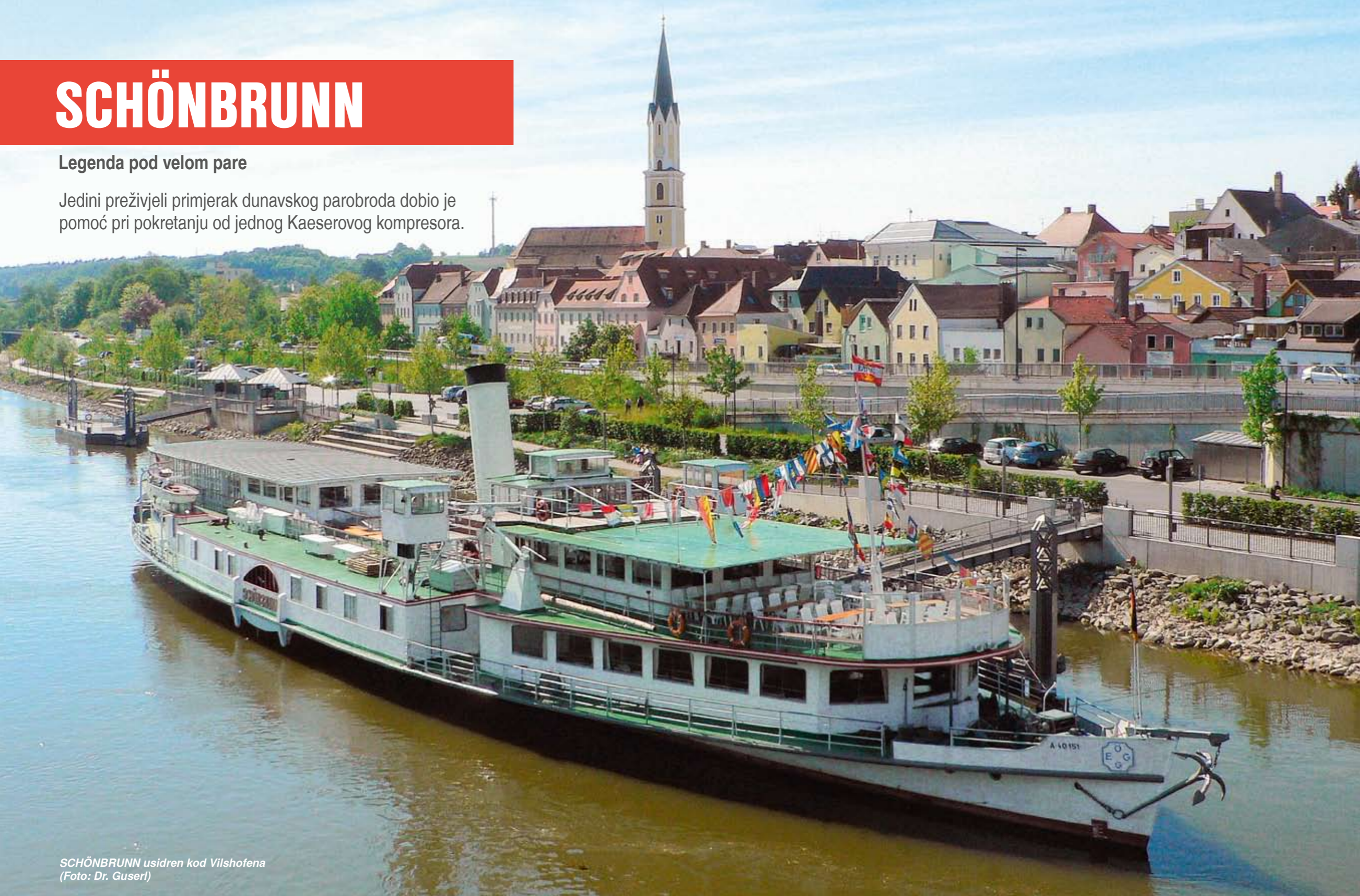
SCHÖNBRUNN usidren kod Vilshofena

Jedini preživjeli primjerak dunavskog parobroda dobio je pomoć pri pokretanju od jednog Kaeserovog kompresora.