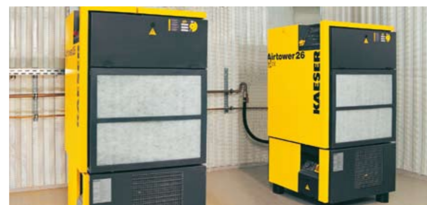
Oba "Airtowera" denitrifikacijskog postrojenja Bisamberg (Donja Austrija)