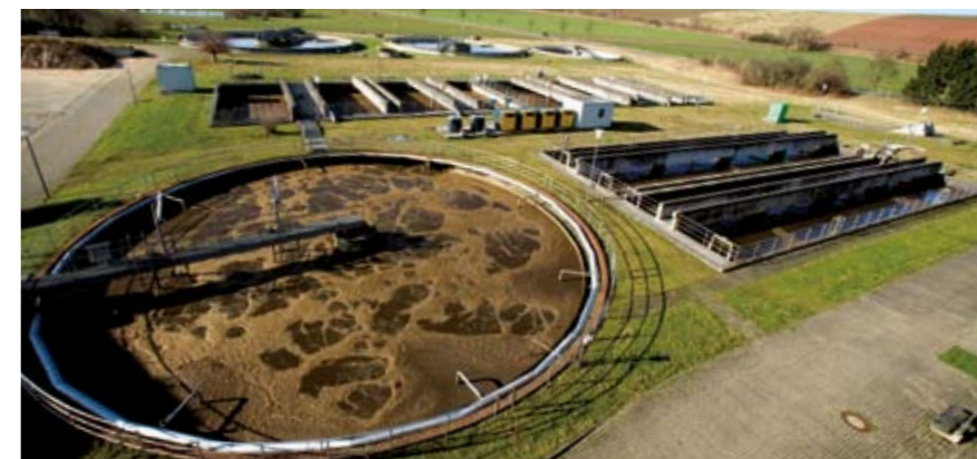
Bazen za oživljavanje u postrojenju za pročišćavanje Scharzfeld/Harz (desno)

nitrifikator (amonifikacija). Uz hidrolizu ureje i razgradnja bjelančevina dovodi do stvaranja amonijaka. Jedan od važnih sastavnih dijelova bjelančevina (proteina) kao aminokiselina je dušik. Amonifikacija se u pretežnom dijelu vrši već u kanalizaciji. Preostali spojevi se u uređaju za taloženje pretvaraju u amonijak. Zatim dolazi do nitrifikacije i denitrifikacije: Kod nitrifikacije prikladni mikroorganizmi oksidiraju amonijak u nitrat. Taj proces, za koji je potrebno puno kisika u takozvanim bazenima za oživljavanje, vrši se u dva stupnja. Ovdje je za preživljavanje bakterija kojima je povjereni čišćenje važna stalna, pouzdana opskrba upuhanim zrakom. Nitrat se u konačnici u okruženju siromašnom kisikom reducira u elementarni dušik pri čemu nitrifikacija i denitrifikacije u suvremenim postrojenjima teku u različitim zonama istog bazena. Uz nitrat se i fosfat ubraja u glavna opterećenja otpadnih voda. Danas fosfat do dvije trećine izvire iz prehrambenih sastojaka