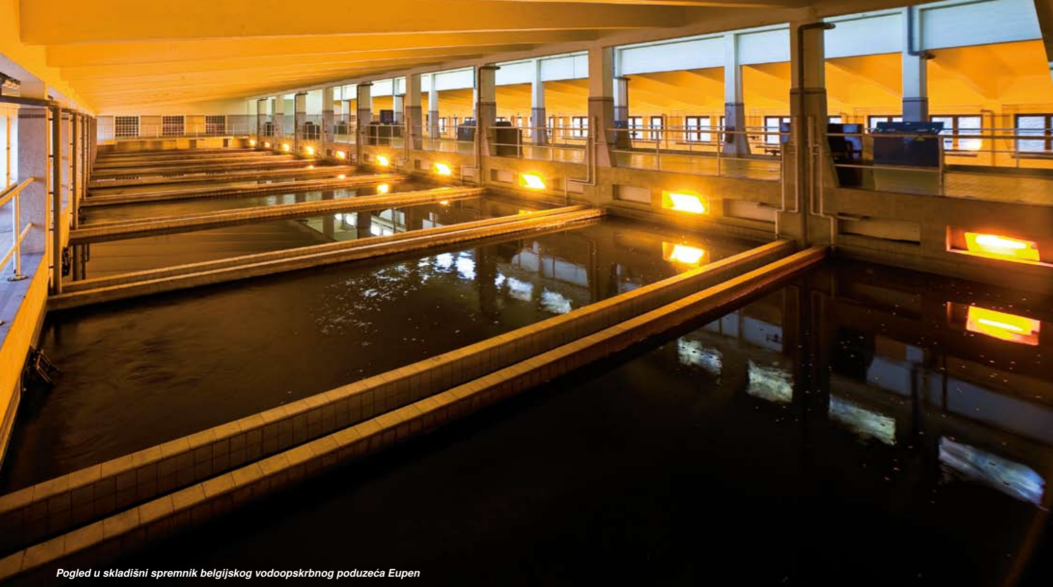
Pogled u skladišni spremnik belgijskog vodoopskrbnog poduzeća Eupen

ka, a samo do jedne trećine iz sredstava za pranje. Kemijsko razlaganje fosfata je skupo i dovodi do obogaćivanja soli u pročišćenoj vodi pa se i ovdje sve više primjenjuje biološki postupak na mikrobnj osnovi. I kod defosfatizacije bazen za oživljavanje čini prvi stupanj. Prozračuje se upuhanim zrakom kako bi se ovdje primijenjenim bakterijama